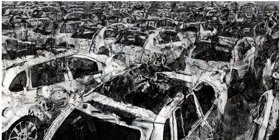
刘勃麟, 《天津大爆炸》, 2016

電話: +1.212.255.4388 傳真: +1.212.255.4316 星期一到星期六, 10AM-6PM