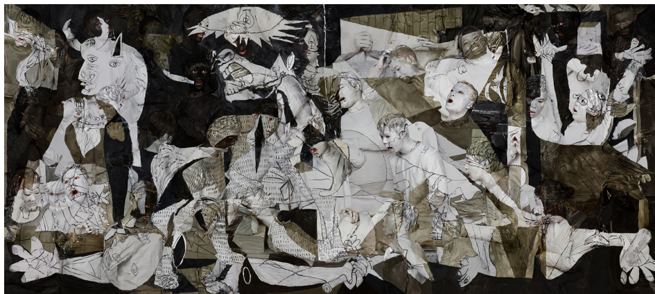
刘勃麟, 《格尔尼卡》, 2016

電話: +1.212.255.4388 傳真: +1.212.255.4316 星期一到星期六, 10AM-6PM