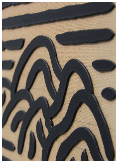
申凡, 山水-C-31 , 2008 (细节), 布面油画, 53 3/8 x 27 1/8 英寸 (138 x 69 厘米), 图片由申凡, 香格纳画廊和奕来画廊提供。

当中国当代艺术仍在被现实主义主导时，1978 年中国的改革开放为它带来了深刻的转变。随着国门的打开以及西方艺术杂志和其他出版物的涌入，许多艺术家感受到了西方艺术的气息，并开始模仿西方的技术与技巧、追随西方的意识形态并将其视为主流。而申凡则通过植根于自己的东方哲学来探讨西方艺术给中国带来的当代性。西方抽象表现主义的主要一支是行动绘画，是直接地在材料上践行豪放而充满张力的笔触，而申凡却保持着自己儒雅的“东方气质”，在他 1992 年至 1993 年的纸本油画创作过程中，他采用了拓印这一种已经在中国传承了千年的传统技法。他的这种作法不是直接的，而是用纸和油彩进行拍印，使原本强烈的情绪变得克制，从而隐射出儒家中庸的价值观以及东方哲学中自省的一面。