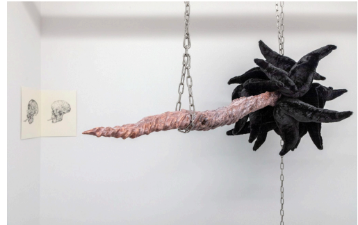
Echo Yan, Please Do Not Feed!, 2022. Materials: clear pine, resin, PVA glue, terracotta tail, plumbies, celtors, metal hook, stainless steel, parrot, on panels. Sculpture: 30 x 64 x 48 inches (76.2 x 113.4 x 121.9 cm). Drawings: 33 x 18 inches (26.4 x 30.3 cm) each.

有关此次展览的最新动态将随着艺术家创作与新作品的最终完成在我们的官网与社交媒体平台上发布。