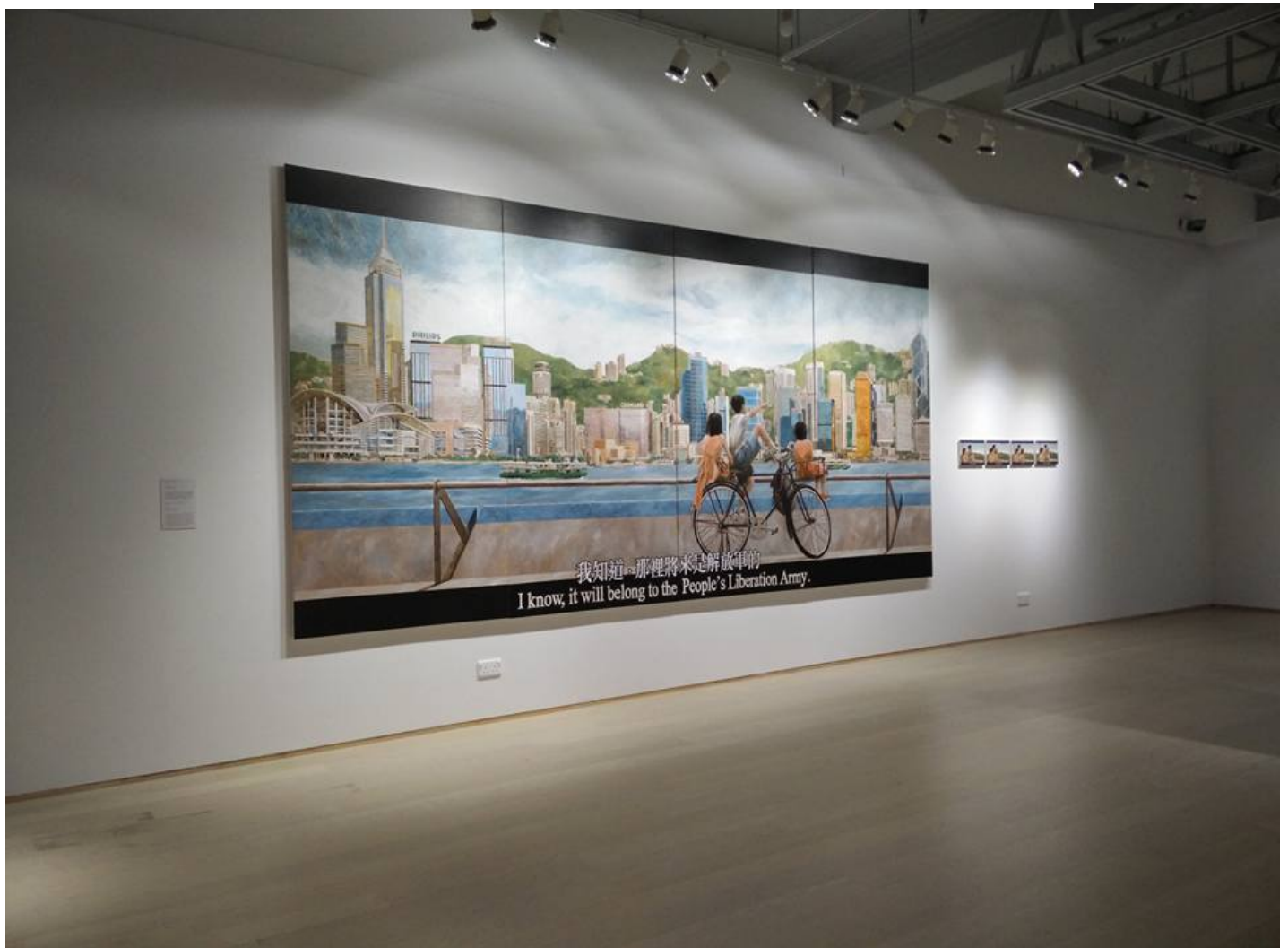
周俊輝 (2015) 《細路祥 — 「那裡將來是解放軍的」》