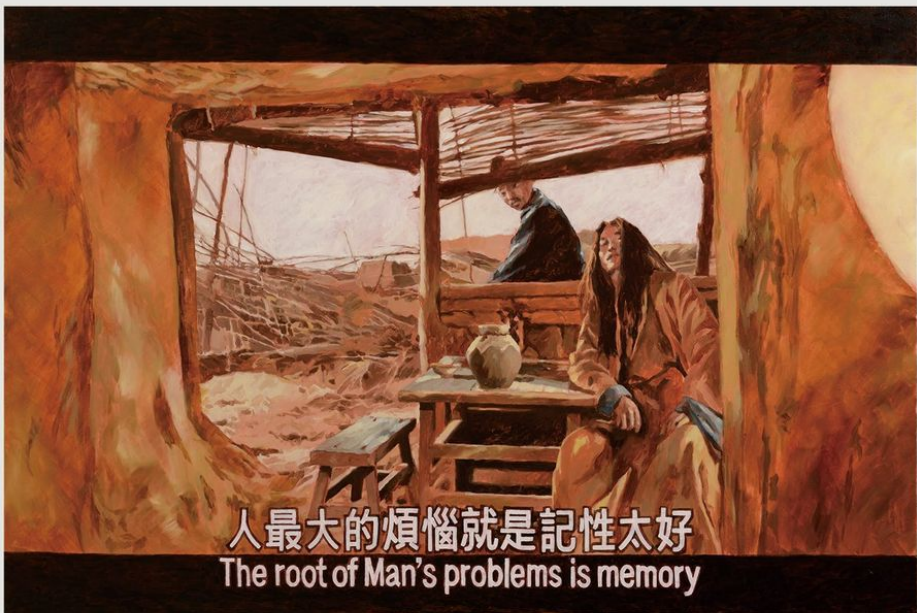
《東邪西毒 - 「風也未吹」》2014

人最大的煩惱就是記性太好 The root of Man's problems is memory