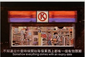
《重慶森林 - 「不知道從什麼時候開始每個東西上都有一個有效限期」》2016