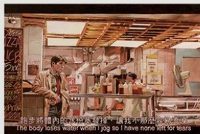
《重慶森林 - 「跑步將會令我的身體失去水分，所以我沒有剩下任何眼淚」》2016

不止於我，對於所有香港人亦然。經過去年甚至這年的動盪後，大家都覺得不一樣，以另一種視角去看身邊事物，就於訪談之前，我在看周鳳輪擔演的《鹿鼎記》，陳百祥飾演的多隆正阿膠奉承討好溫倫演演的康熙，看到這個畫面不禁讓我皺眉，投入不了看下去，更怎樣創作呢。