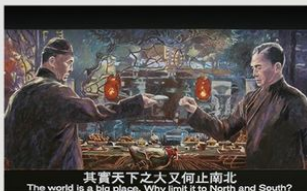
《一代宗師 - 「其實天下之大又何止南北」》2018